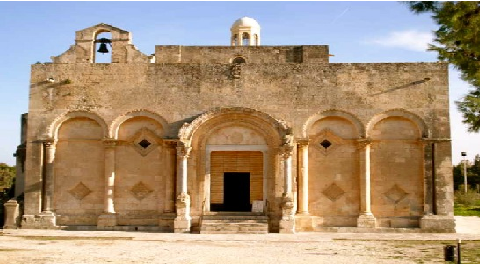
basilica di siponto